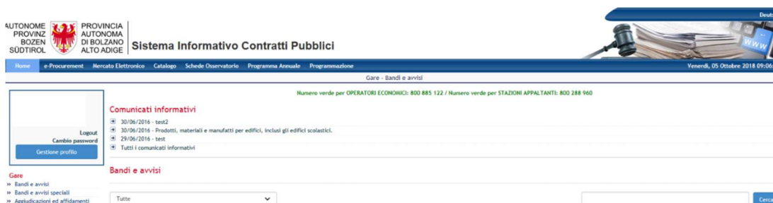
Figura 3 – Pulsante "Gestione profilo"

L'Operatore Economico, dopo essersi iscritto all'Indirizzario e quindi essersi collegato con la sua User e Password, può controllare lo stato della propria iscrizione all'Indirizzario, all'Elenco Telematico e alla relativa sezione per i Servizi di Architettura e Ingegneria mediante il nuovo pulsante "Gestione profilo" (posizionato sotto il link 'Cambio password' nel riquadro contenente lo username dell'OE, v. Figura 3).