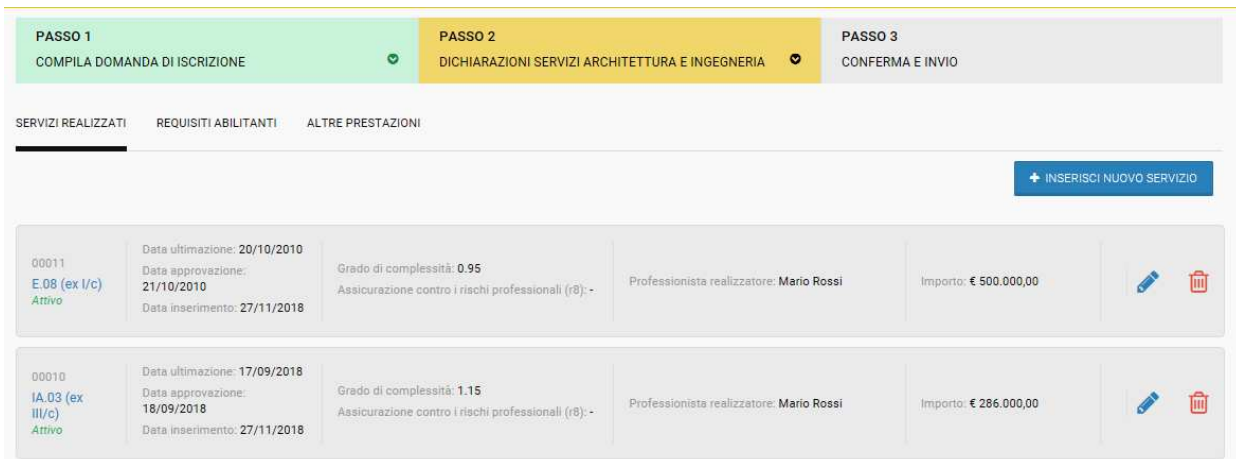
Figura 19 – “Servizio inserito”

Modifica dei servizi inseriti - I servizi inseriti a sistema possono essere modificati dopo l’inserimento iniziale, per farlo è necessario cliccare sull’icona modifica (a forma di matita) presente nella parte destra di ciascuna riga contenente i servizi inseriti. L’azione di modifica consente di riaprire le pagine per la configurazione dei dati relativi al servizio stesso, in modo da effettuare le modifiche opportune. Al termine dell’operazione è possibile cliccare “Salva” per tornare al riepilogo dei servizi inseriti.