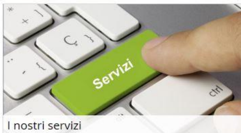
I nostri servizi