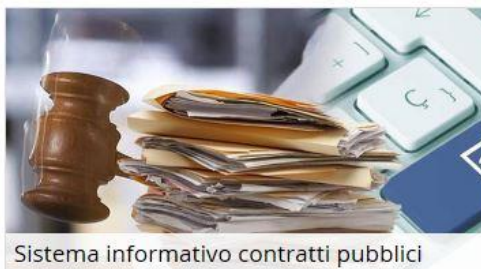
Sistema informativo contratti pubblici