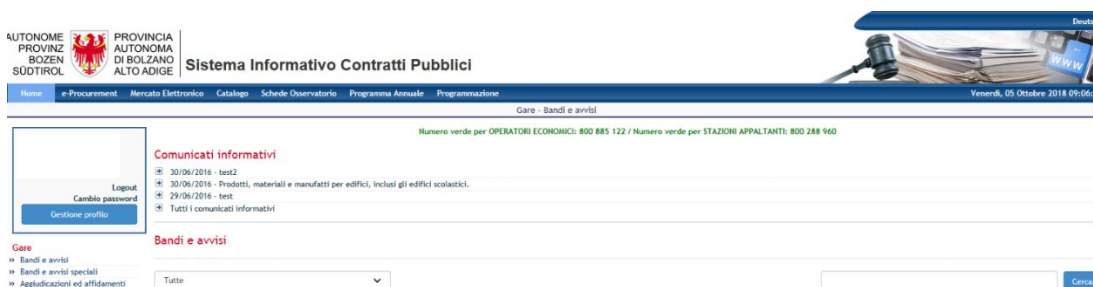
Figura 3 – Pulsante "Gestione profilo"

L'Operatore Economico, dopo essersi iscritto all'Indirizzario e quindi essersi collegato con la sua User e Password, può controllare lo stato della propria iscrizione all'Indirizzario, all'Elenco Telematico e alla relativa sezione per i Servizi di Architettura e Ingegneria mediante il nuovo pulsante "Gestione profilo" (posizionato sotto il link 'Cambio password' nel riquadro contenente lo username dell'OE, v. Figura 3).