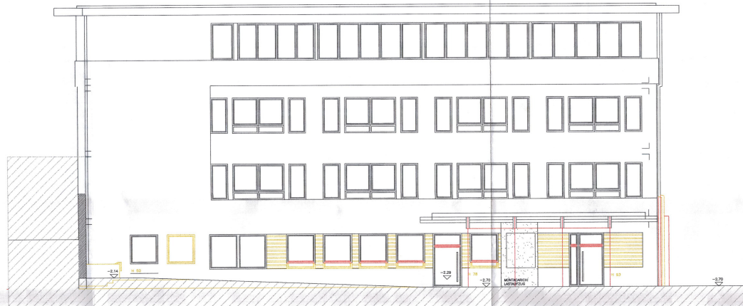
ANSICHT OST BEREICH "B" PROSPETTO EST PARTE "B"