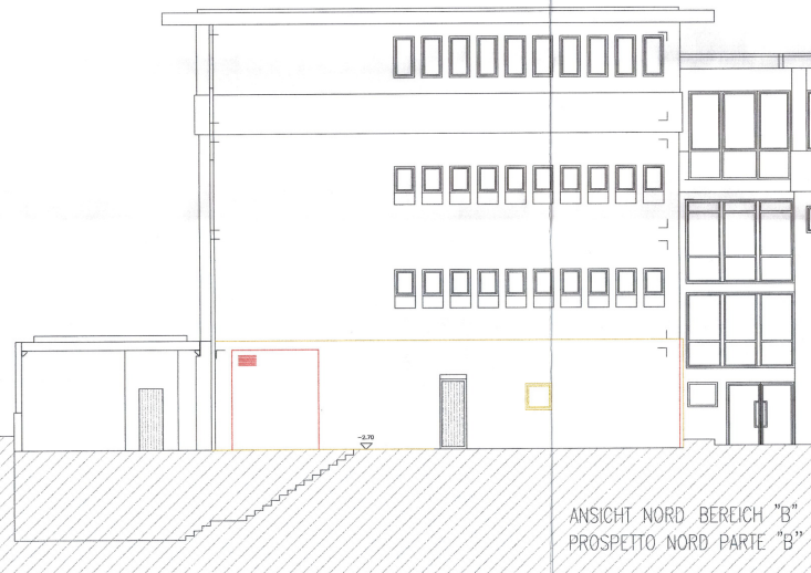
ANSICHT NORD BEREICH "B" PROSPETTO NORD PARTE "B"