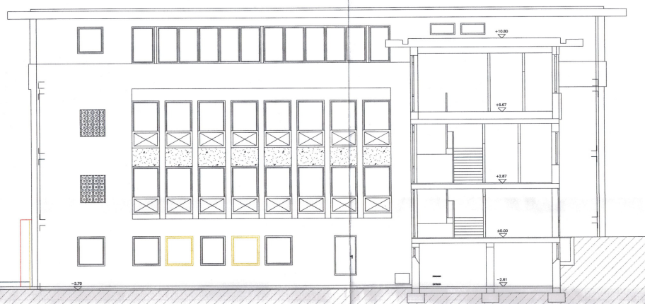
ANSICHT WEST BEREICH "B" PROSPETTO OVEST PARTE "B"