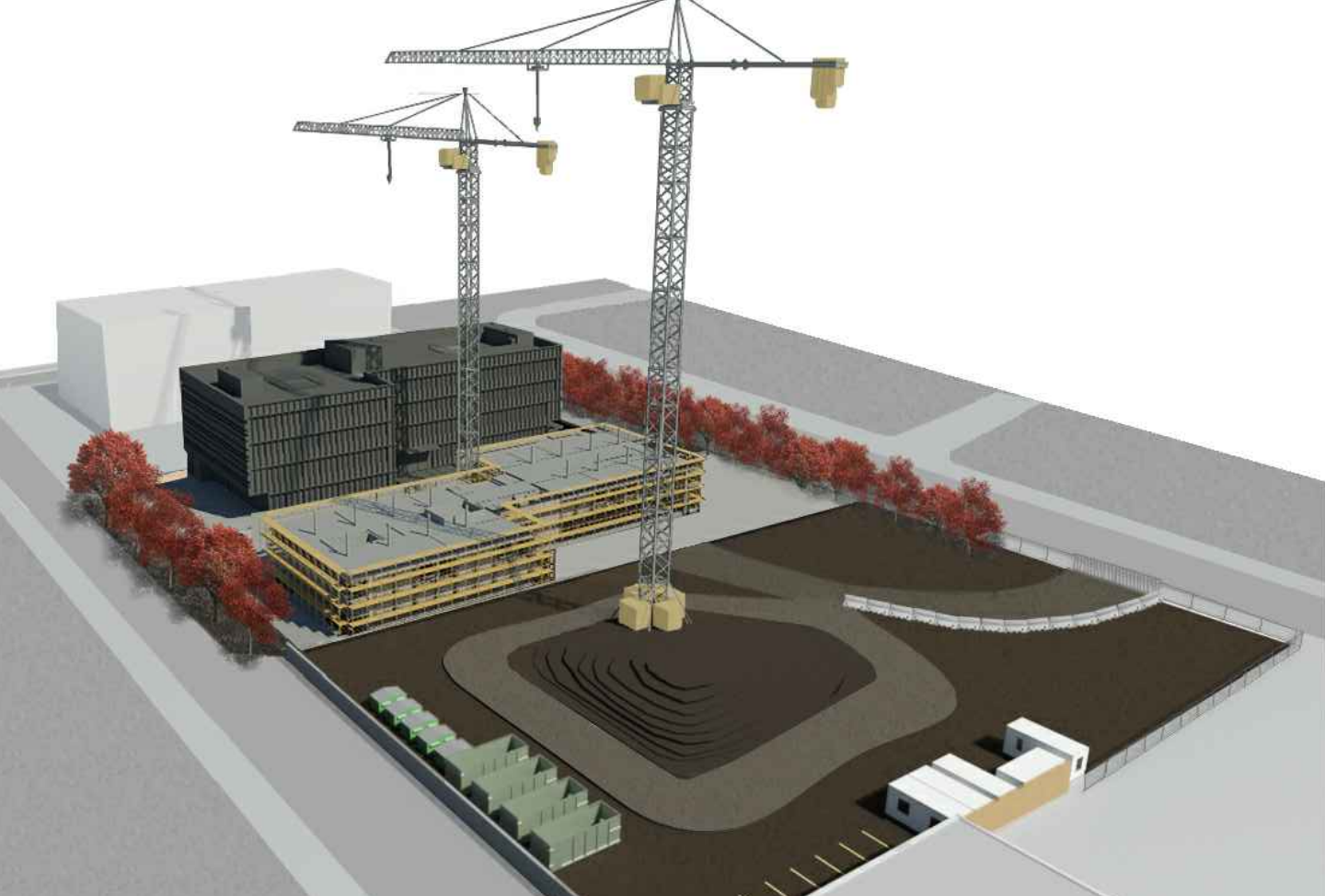
Fase di lavoro / Bauphase: Completamento D2 e finiture D3/ Fertigstellung D2 und Ausbau D3